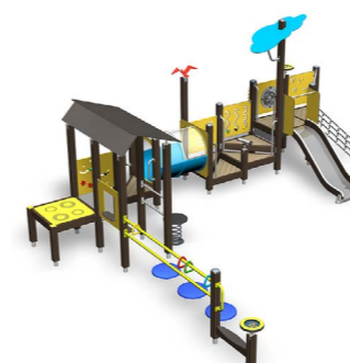
Inklusiver Spielplatz S 137601