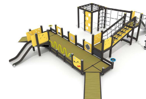
Inklusive Kombi-Spielplatz Q13616