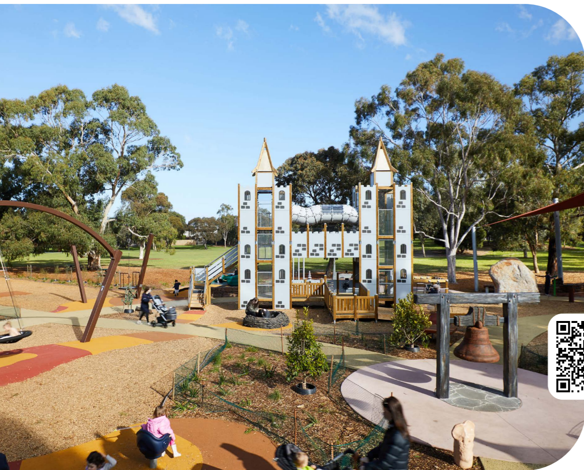
Thomas Street Park, South Hampton | Australien