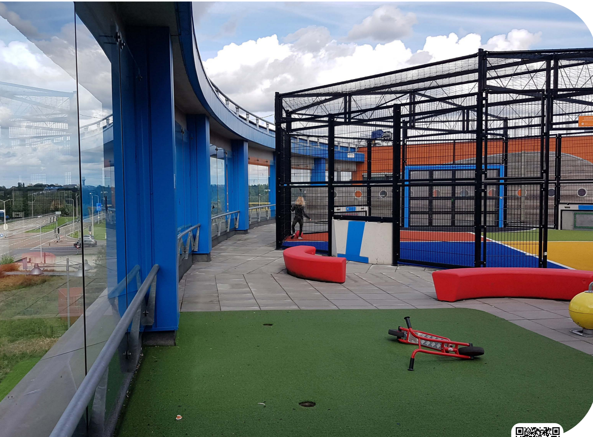
Wilhelmina Ziekenhuis, Utrecht | Niederlande