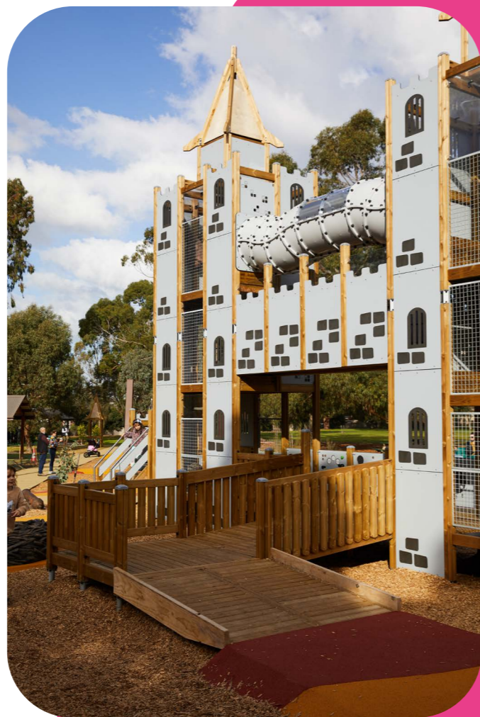
Tytylcenter De Witte Vogel – Den Haag | Niederlande

Tauche ein in die Welt des inklusiven Designs und sieh selbst, wie unsere innovativen Lösungen die Spiel- und Freizeitmöglichkeiten für alle verbessern. Besuche unsere Referenzseite und lass dich von den spannenden Möglichkeiten inspirieren, die Lappset bietet.