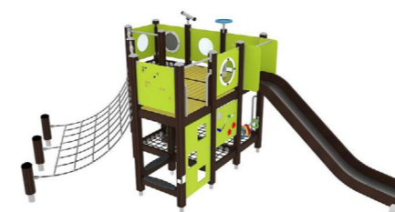
Inklusives Spielhaus Q14661