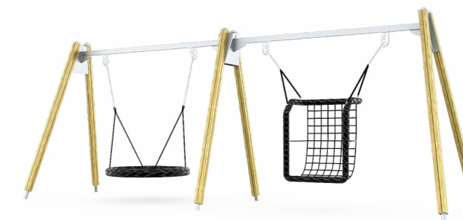
Doppelte Inklusion Schaukel – inkl. Nestschaukelkörbe Q16431