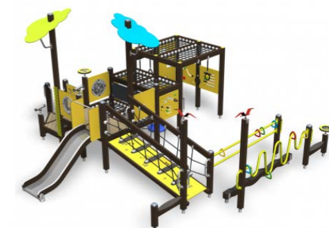
Inklusiver Spielplatz M 137602